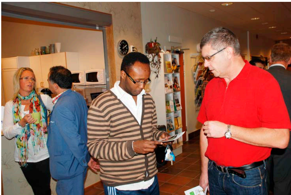
Bilden är från Jobbmässan/Starta eget-mässan 2009