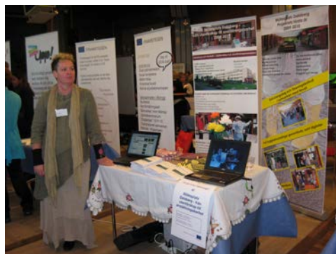
”EU gör nytta i Västsverige”

Projektet var med på seminariedagen ”EU gör nytta i Västsverige” den 20 oktober 2010. Här spreds information i form av utställning och Miniseminarie och nya kontakter knöts med andra projekt.