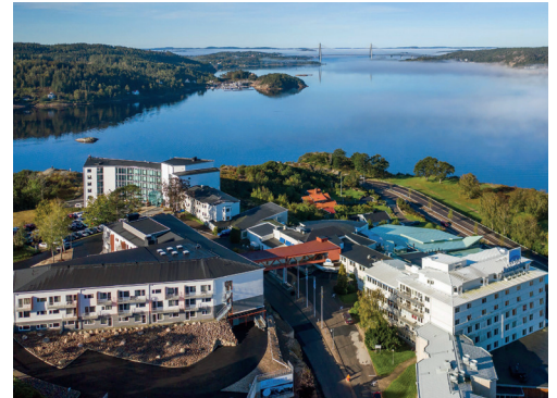
Flygbild över Bohusgården Hotell & Konferens med utsikt mot Uddevallabron.

Devisen på Bohusgården lyder "är du inte under utveckling så är du under avveckling". Och det lever de verkligen upp till. Under första kvartalet 2019 öppnade de en ny spa-avdelning. Hösten 2019 invigdes en helt ny hotelldel med 65 nya sviter och just nu pågår en tillbyggnad av restaurangen för fullt. Det skall bli ytterligare 125 platser och totalt kan Bohusgården då erbjuda 400 platser i huvudrestaurangen. Tillbyggnaden var inplanerad redan innan pandemin bröt ut och förhoppningsvis kommer utbyggnaden av restaurangen att bli klar någon gång i november. Planen är att kunna erbjuda julbord med övernattnings i december på ett Corona-säkert sätt.