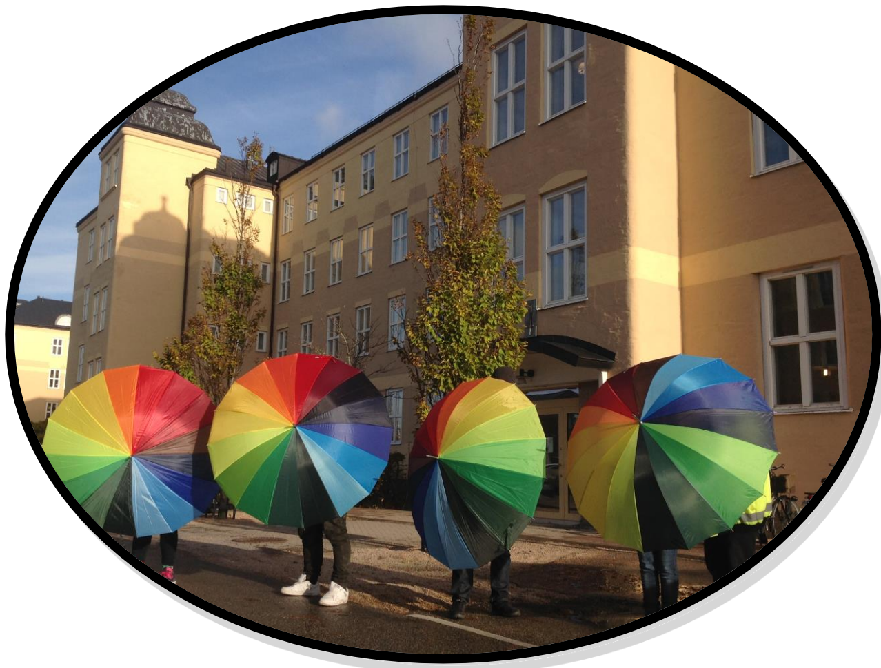
Foto och bilder av elever på Särskild utbildning för vuxna.

RO2; Särskild utbildning för vuxna 2018-2019