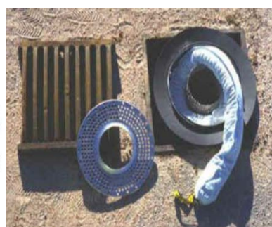
Exempel på ett brunnsfilter med filtermaterial