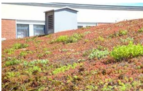
Exempel på vegetationsklädda tak.

Vegetationsklädda tak kan tex vara sedumtak och kan användas både på huvudbyggnader och komplementbyggnader som till exempel förråd och cykelskjul för att till exempel öka grönytefaktorn. Förutom att de är estetiskt tilltalande så kan de även bidra till den biologiska mångfalden och medföra sänkta halter av luftföroreningar. Beroende på takets uppbyggnad, lutning samt rådande klimat, så kan vattenavrinningen minska med cirka 50 % på årsbasis. Gröna tak innebär vissa utmaningar och har en högre anläggningskostnad, men dagens moderna uppbyggnad gör dock att underhållsbehov och risker minskat.