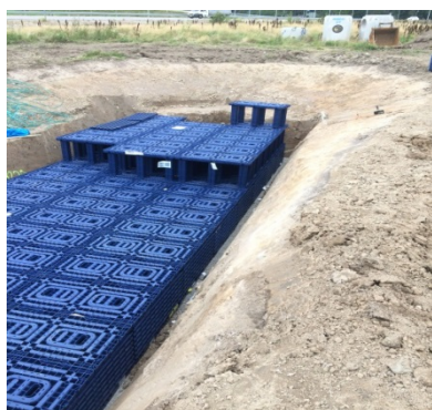
Dagvattenmagasin med plastkassetter (Torp)

Utformningen av ett dagvattenmagasin kan se ut på många olika sätt men principen är en utschaktad grop fylld med material med stor hålrumsvolym vars uppgift är att reducera toppflöden samtidigt som den naturliga vattenbalansen bevaras. Förr var stenkistan bestående av tvättad mackadam den vanligaste typen av utförande, men numera används allt oftare plastkassetter då de inte kräver lika stor plats och är lättare att anlägga.