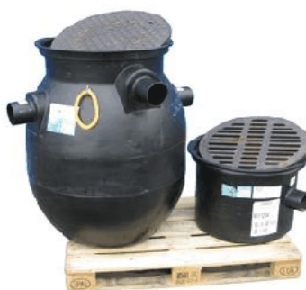
Exempel oljeavskiljare i olika storlekar