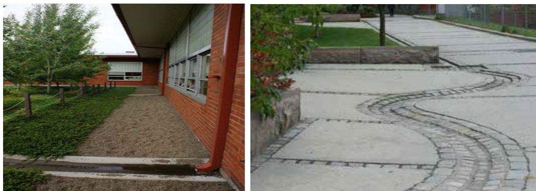
Exempel på stuprörutkastare och ränndalar i Uppsala kommun.

Stuprörutkastare används för att ytligt avleda dagvatten från tak ner mot marknivå. Beroende på anslutande ytors användning och beskaffenhet så kan vattnet antingen infiltreras direkt eller avledas via ränndalar till exempelvis översilningsytor och växtplanteringar på gård, förgårdsmark eller till ett dagvattensystem.