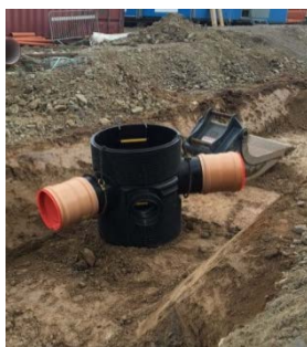
Dagvattenbrunn med sandfång som används i Sundsstrand

Några typexempel är brunnar med sandfång, oljeavskiljare och brunnsfilter.