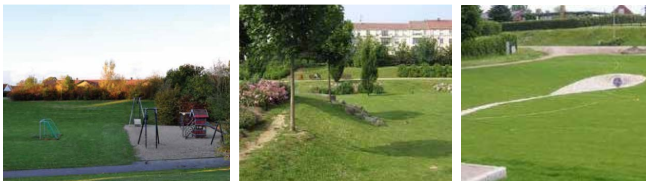
Exempel på multifunktionella ytor i stadsmiljö

Multifunktionella ytor används för att utjämna flöden och undvika skador vid kraftig nederbörd genom att tillfälliga vattenspeglar bildas. De kan utformas som försänkningar i hårdgjorda ytor eller som gräsbeklädda ytor med flacka slänter. Med ett reglerat utlopp för det dimensionerande utflödet från området töms det sedan successivt då avrinningen avtar. Under torrväder kan ytan användas till andra ändamål, till exempel som spel- och lekytor.