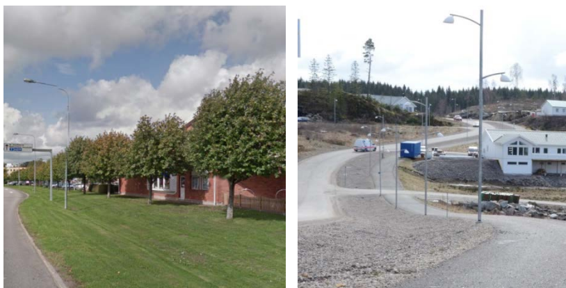
Svackdike längs med Bastiongatan och makadamfyllda diken längs Västra Sundskogsvägen

Ökade dimensioner på markförlagda dagvattenledningar ger relativt sett måttliga kapacitetsökningar jämfört med öppna stråk som kan leda bort mycket stora flöden. Öppna ytliga avledningssystem kan även medföra andra fördelar som bevarad vattenbalans, minimerad föroreningspåverkan och berikad stadsmiljön. Beroende på dess syfte kan diken utformas som t.ex. biodike, svackdike eller makadamfyllda diken med en dränerande ledning i botten.