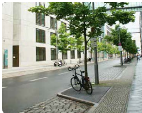
Exempel på vattengenomsläpplig beläggning och skelettjordsplanterade träd i Uppsala kommun.