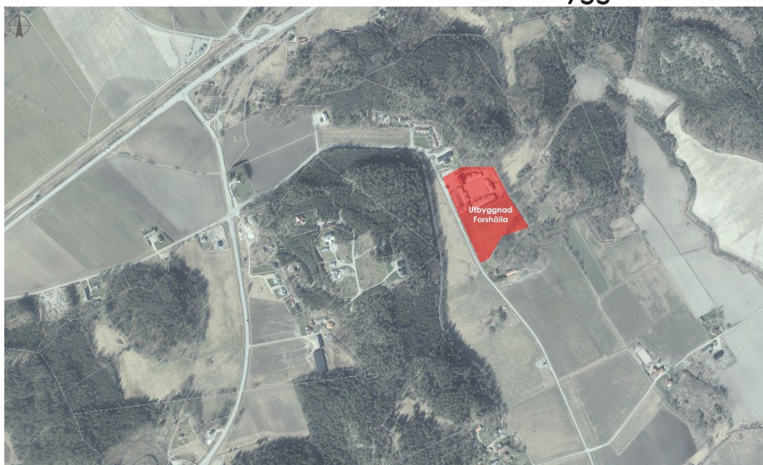
Figur 7. Lokaliseringsalternativ Forshälla