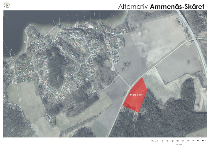
Figur 12. Alternativ Södra Skäret

Södra Skäret bedöms inte på ett likvärdigt sätt uppfylla förutsättningarna för lokaliseringprincipen likt detaljplaneområdet. Alternativet bedöms inte som tillfredställande för föreslagen verksamhet samt tar även i sin helhet jordbruksmark i anspråk.