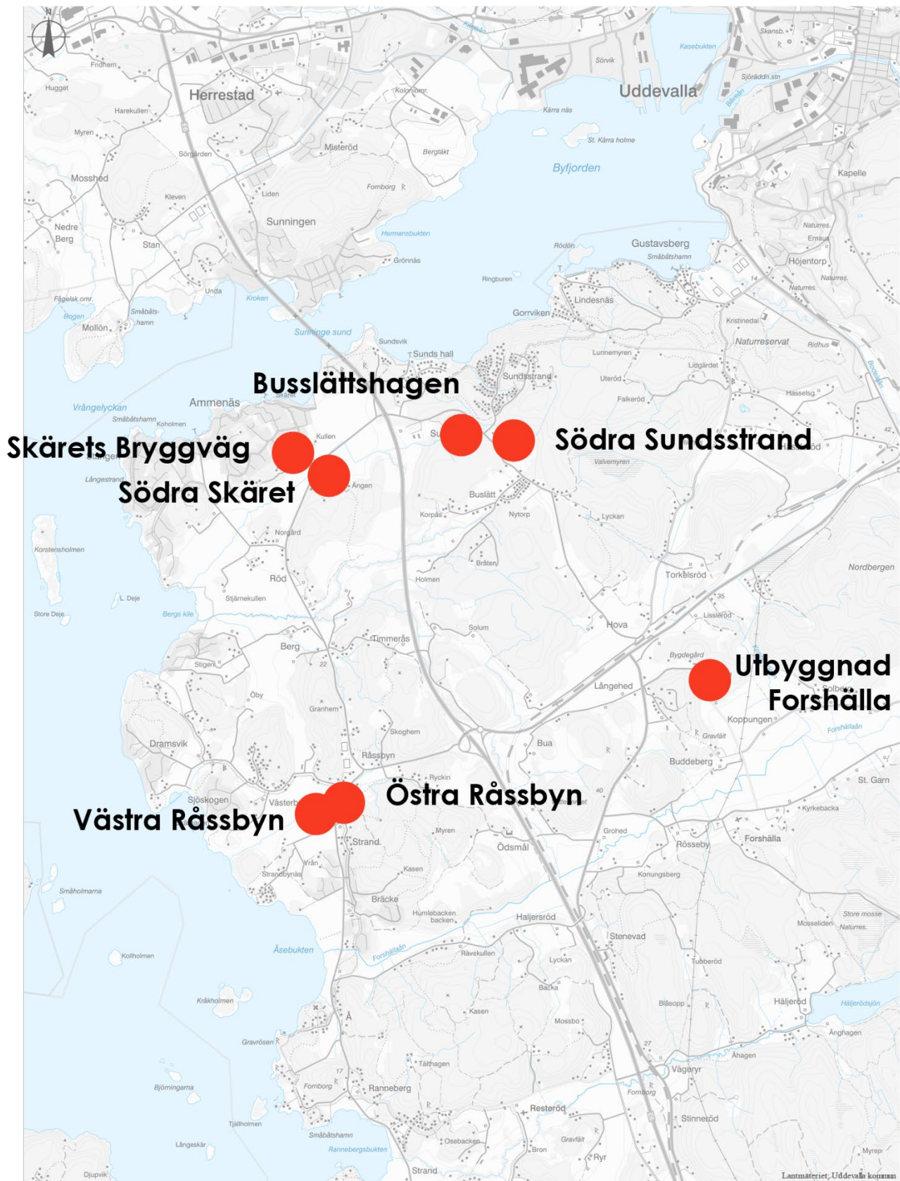
Figur 3. Alternativredovisning