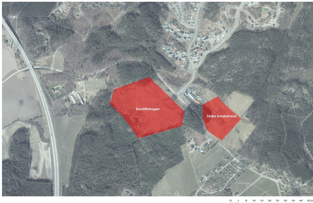
Figur 5. Lokaliseringsalternativ Sundsstrand-Busslätt