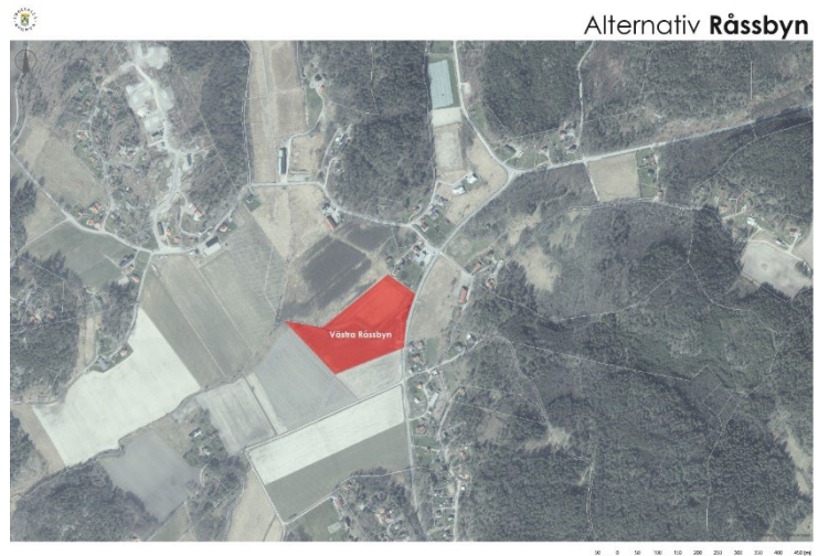
Figur 15. Västra Råssbyn