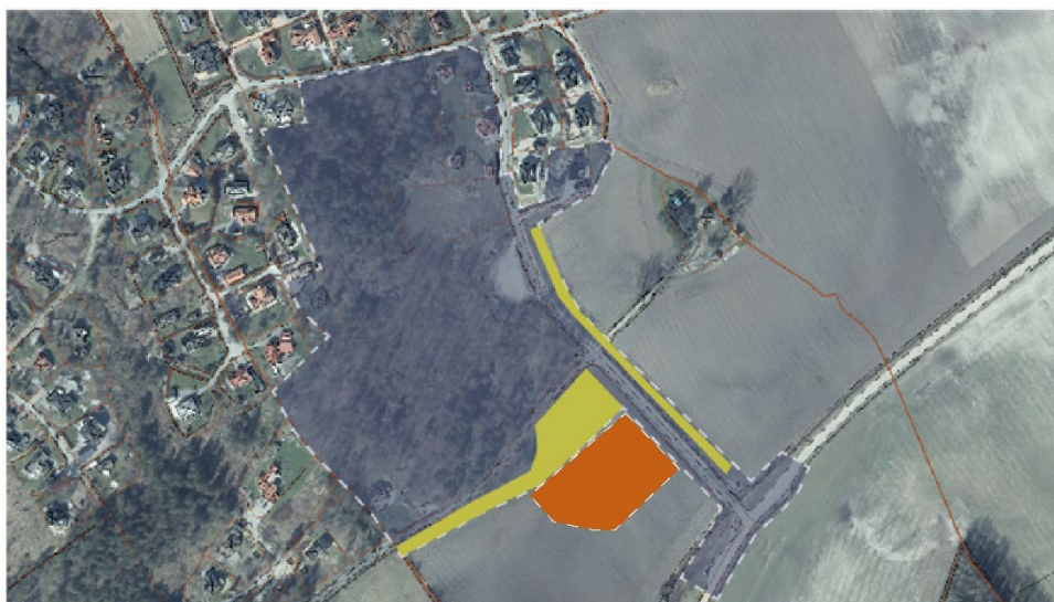
Figur 1. Jordbruksmark som berörs av planförslaget, Skärets Bryggväg (Gult redovisar alternativ 1 och gult & orange redovisar alternativ 2)