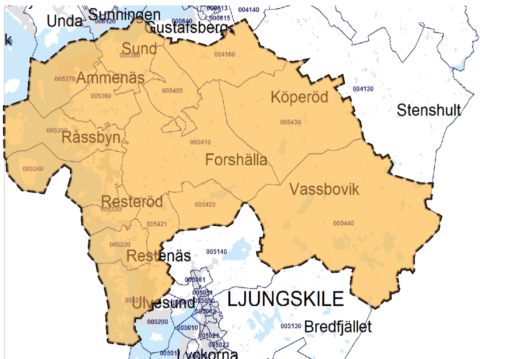
Figur 2. Upptagningsområde för skola i området Ammenäs-Forshälla

Uddevalla Kommun har inför ansökan om upprättandet av detaljplan för ny skola inom Forshälla-Röd 2:12 m.fl. utrett vilka alternativa platser som kan vara lämpliga för etablering av ny kommunal service. Två huvudalternativ har i förstudien (Uddevalla Kommun, 2019-11-22) presenterats. För mer information kring utredning hänvisas till förstudien.