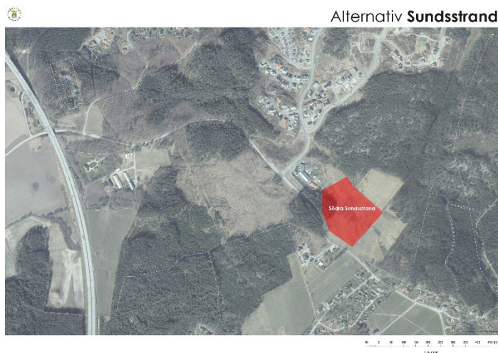
Figur 14. Alternativ Södra Sundsstrand

Lokaliseringsalternativet bedöms ur många sociala aspekter som lämplig plats, men tar en stor del jordbruksmark i anspråk samt strider mot översiktsplanen. Vidare finns andra planmässiga osäkerheter kring geoteknik. Inom området finns känd fornlämning, L1970:5926 samt eventuellt ytterligare fornminnen. Alternativet bedöms därför som helhet vara mindre lämpat för föreslagen markanvändning samt har andra intressen som kan väga tyngre.