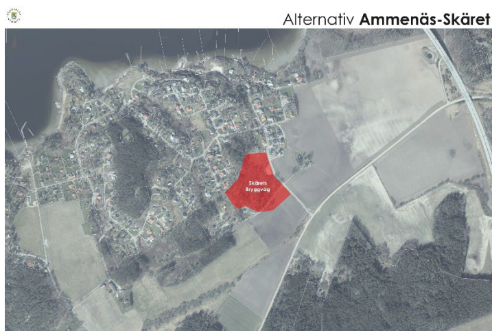
Figur 10. Skärets Bryggväg lokalisering

Alternativ 2 för Skärets bryggväg tar lite mer jordbruksmark i anspråk (0,5 ha mer) än alternativ 1. Däremot kan fornlämningsområde L2020:10580 läggas inom naturmark. Osäkerhet finns ändå för fornlämningen då den ligger inom område som eventuellt måste bergsäkras. Kvartersmarken ligger fortfarande i huvudsak inom område som inte berör jordbruksmark. Sammantaget bedöms lokaliseringen lämpad från de förutsättningar som framkommit i förstudien. Det gäller bland annat frågan kring mobilitet, påverkan på infrastruktur, yta, möjlighet till synergieffekter med befintlig samhällsstruktur, barnens möjlighet att själva ta sig till och använda platsen.