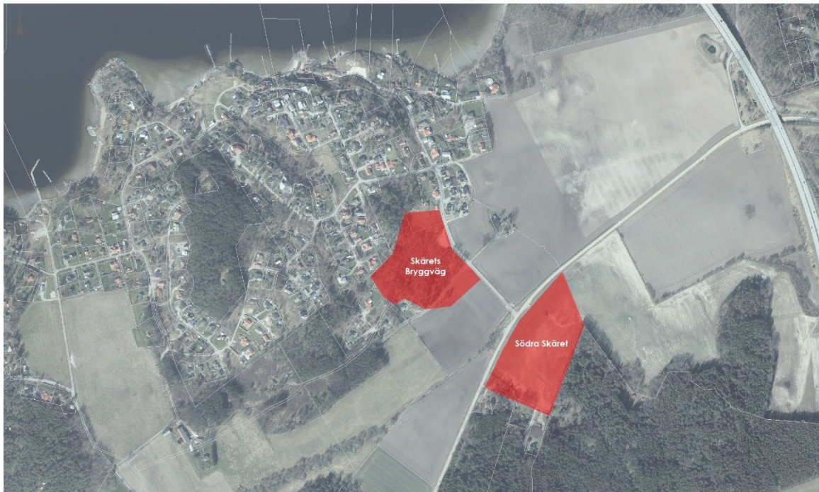
Figur 4. Lokaliseringsalternativ Ammenäs-Forshälla