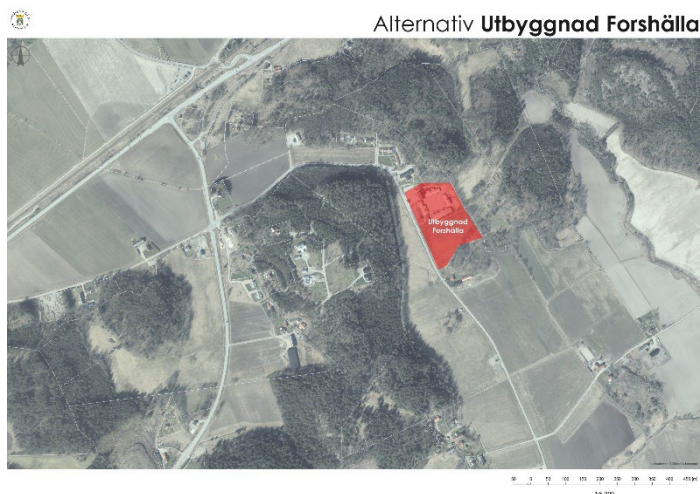
Figur 16. Utbyggnad Forshällaskolan Källa: Uddevalla Kommun

En utbyggnad av skolan till dubblad kapacitet har flertalet utmaningar. En expansion kräver ianspråktagande av jordbruksmark. En utökning kräver även investeringar i Vatten- och väginfrastruktur. Markområdena i närheten till befintlig skola säkerställer inte att friyterekommendationer kan tillgodoses.