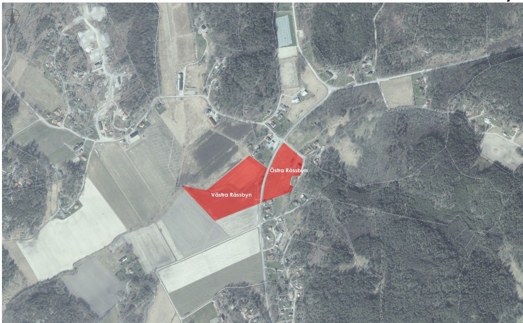
Figur 6. Lokaliseringsalternativ Råssbyn-Strand