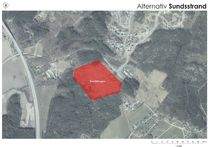
Figur 13. Alternativ Buslättshagen

Alternativet tar ingen jordbruksmark i anspråk. Förslaget bedöms däremot inte som tillfredsställande på grund av kultur- och miljöförutsättningar, buller, samt att det olik andra alternativ inte bidrar till synergieffekter i samma utsträckning. Området är i dagsläget perifert och kräver stora investeringar i infrastruktur, inte bara i direkt anslutning till planområdet men även potentiella följdinvesteringar på infrastrukturen mellan Sundsstrand och Bratterödsleden. Buller från E6 gör att skolverksamhet inte bedöms kunna anläggas här.