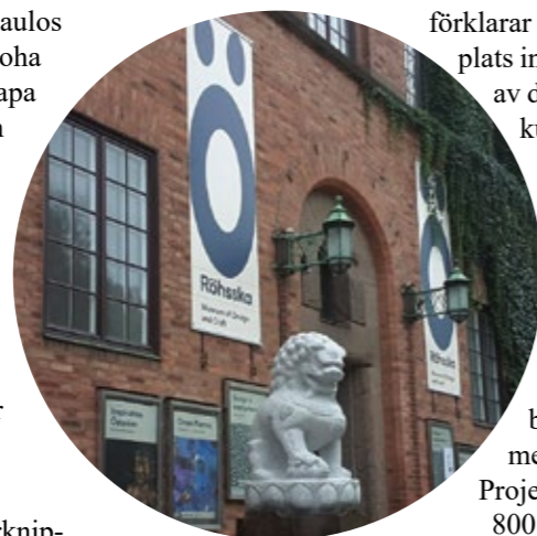
Ett av de två granitlejonerna på plats utanför Röhsska museet i Göteborg.