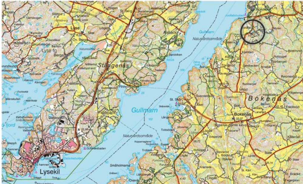
Orienteringskarta över Jordfall