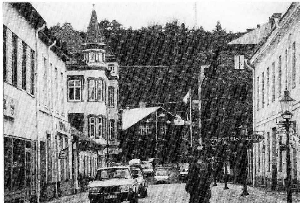
Trädgårdsgatan mot norr och Kålgårdsberget

Med små ekonomiska medel kan positiva effekter uppnås vad gäller miljöupplevelse och tillgänglighet. Ett kraftigt ökat utnyttjande av bergen kan i och för sig innebära risk för att miljön tar skada, men denna risk bedöms vara försumbar i förhållande till den nytta upplevelsen av bergen kan ge.