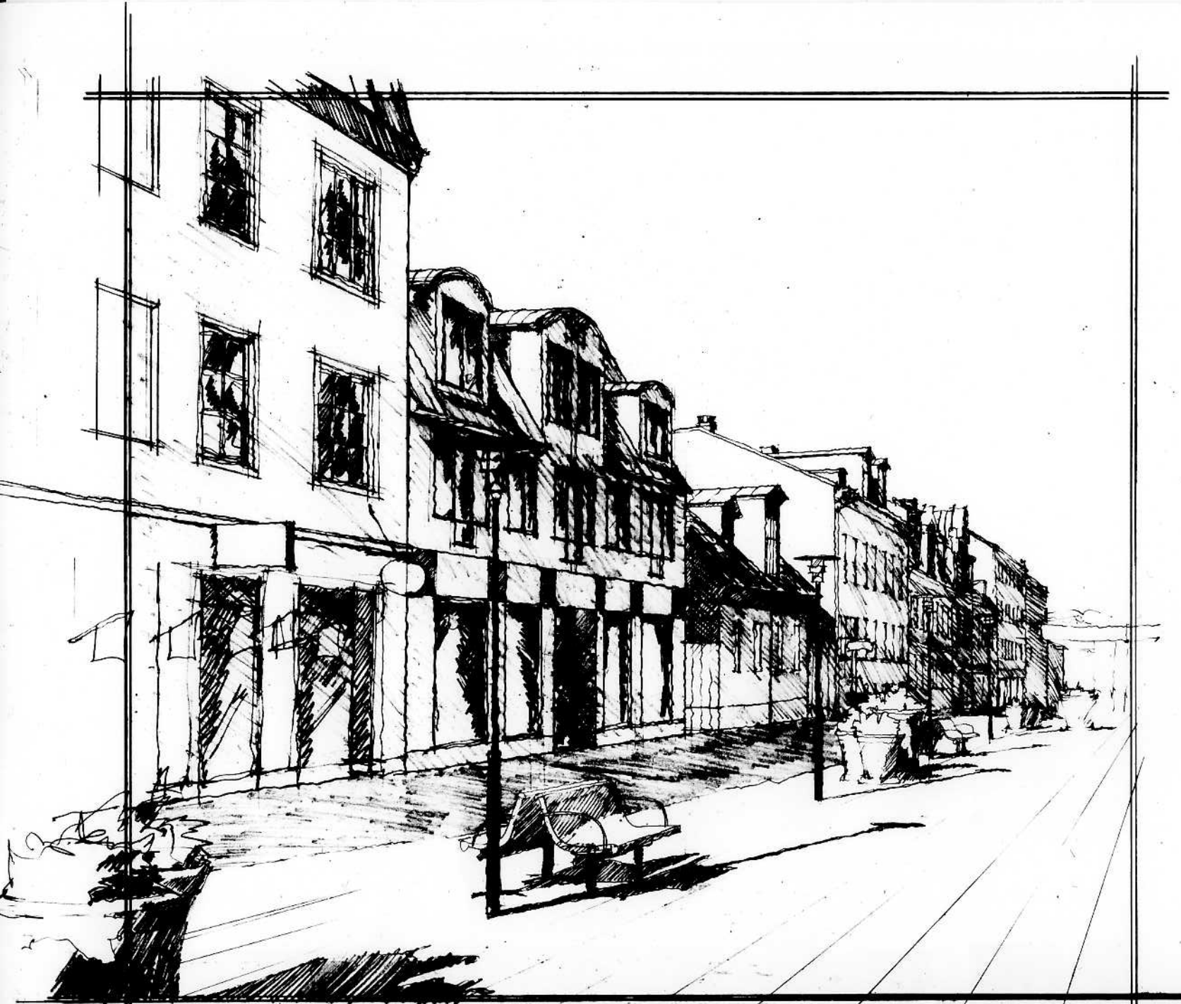
Förslag till nybyggnad på Kungsgatan 36 i kvarteret Krummedike