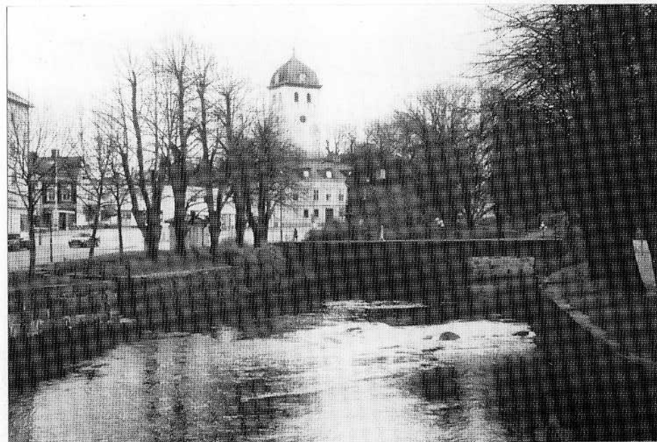
Bäveån österut från Hanssonska bron

Med enkla medel kan Bäveån och Byfjorden upplevas mer positivt och bli attraktiva inslag i staden. Kultur- och naturmiljön kring vattendragen görs mer tillgänglig samtidigt som föreslagna åtgärder inte bedöms belasta miljön. Ingrepp i Bäveån som ändrar t ex laxens förutsättningar att leka får inte göras. Åtgärderna förstärker området som en viktig plats för centrala staden och gör den attraktiv och tillgänglig för olika kategorier av människor som bor i, verkar i eller besöker stadskärnan. Föreslagna åtgärder innebär låga eller rimliga kostnader i förhållande till nyttan. Vissa åtgärder bör ske i samverkan med andra åtgärder; t ex bör en flyttning av fjordbåtarna inte ske förrän andra åtgärder på Kampenhofsområdet kommer till stånd.